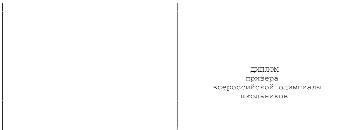
Оборотная сторона обложки